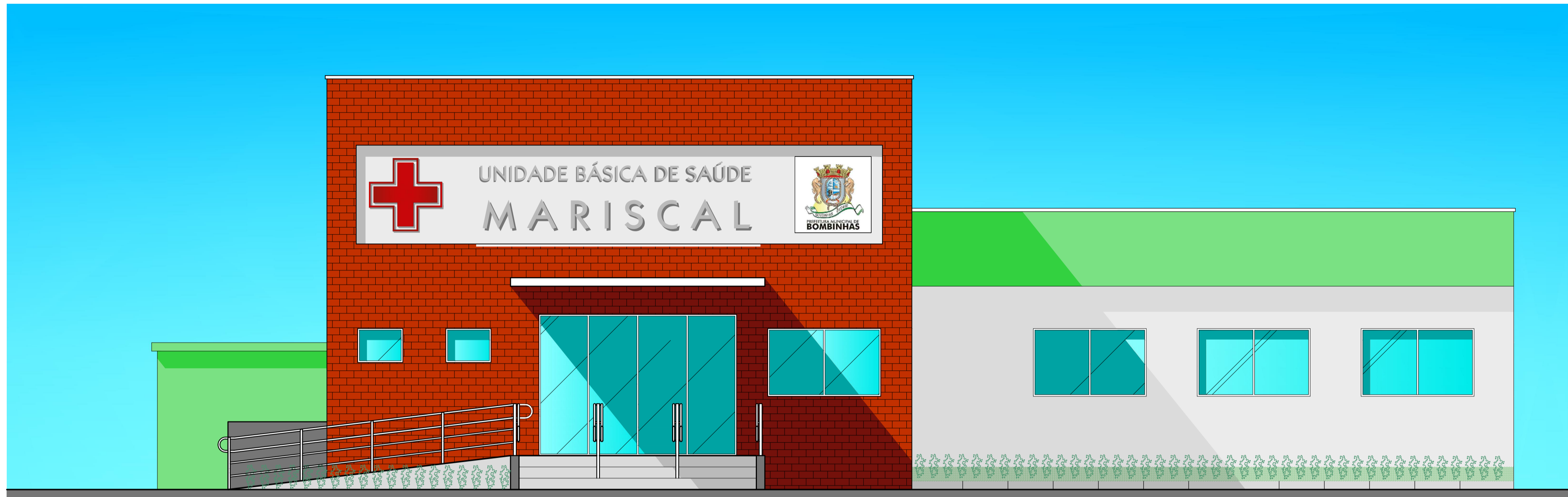
ELEVAÇÃO SUDESTE - (AVENIDA DIAMANTE) ESCALA 1:50