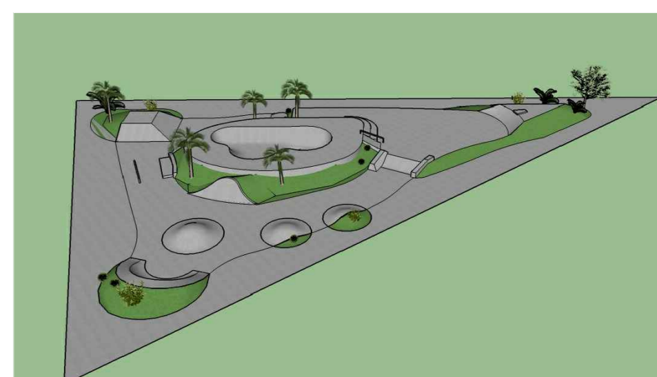
PERSPECTIVA 04 - VISTA AÉREA RUA CANELA