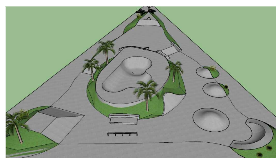
PERSPECTIVA 03 - VISTA AÉREA AV. ARAUCÁRIA