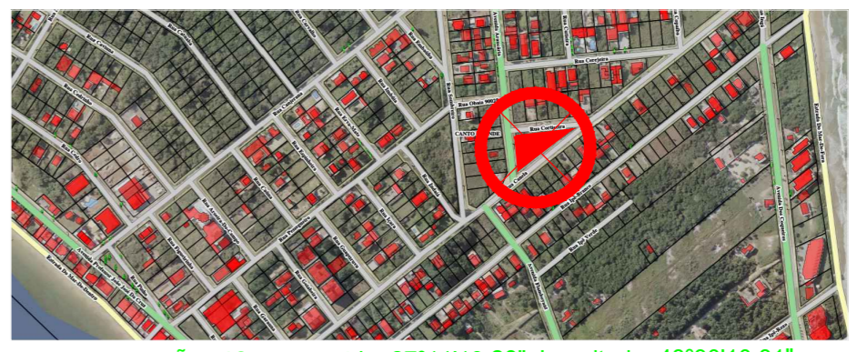
LOCALIZAÇÃO NO - Latitude: 27°11'13.28", Longitude: 48°30'10.81"