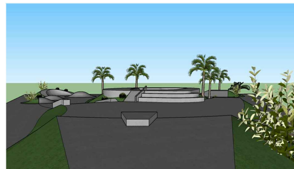
PERSPECTIVA 01 - VISTA CENTRAL