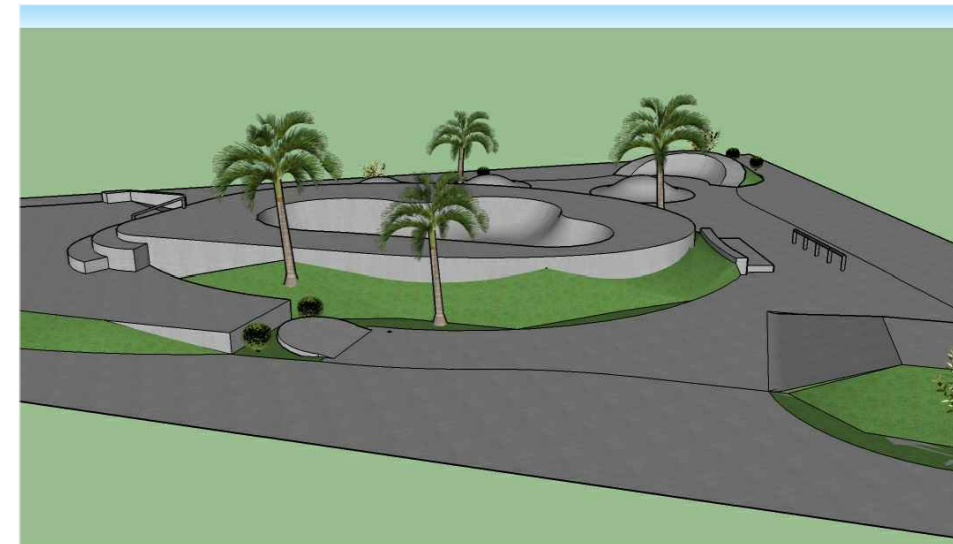
PERSPECTIVA 02 - VISTA RUA CORTICEIRA