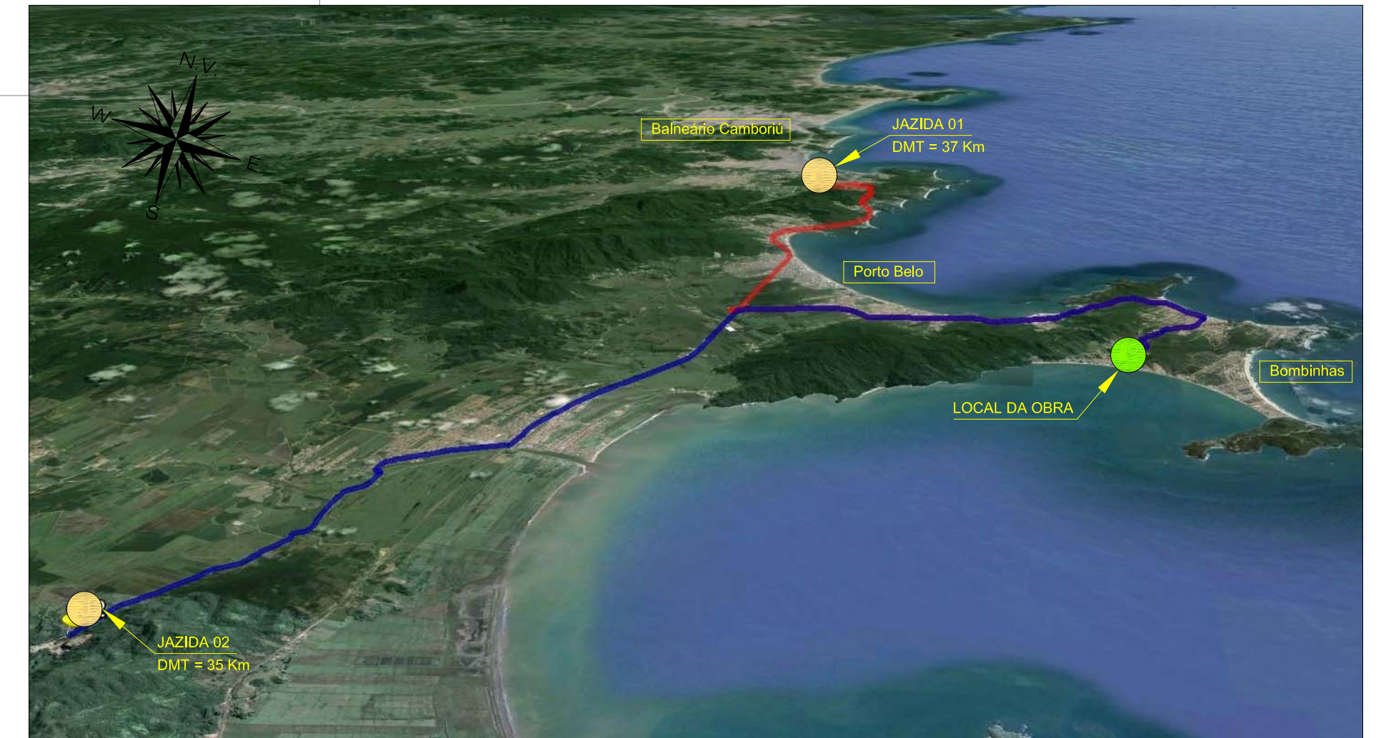
LOCALIZAÇÃO DAS JAZIDAS DE EMPRÉSTIMO (DMT considerado 36km) S/ escala