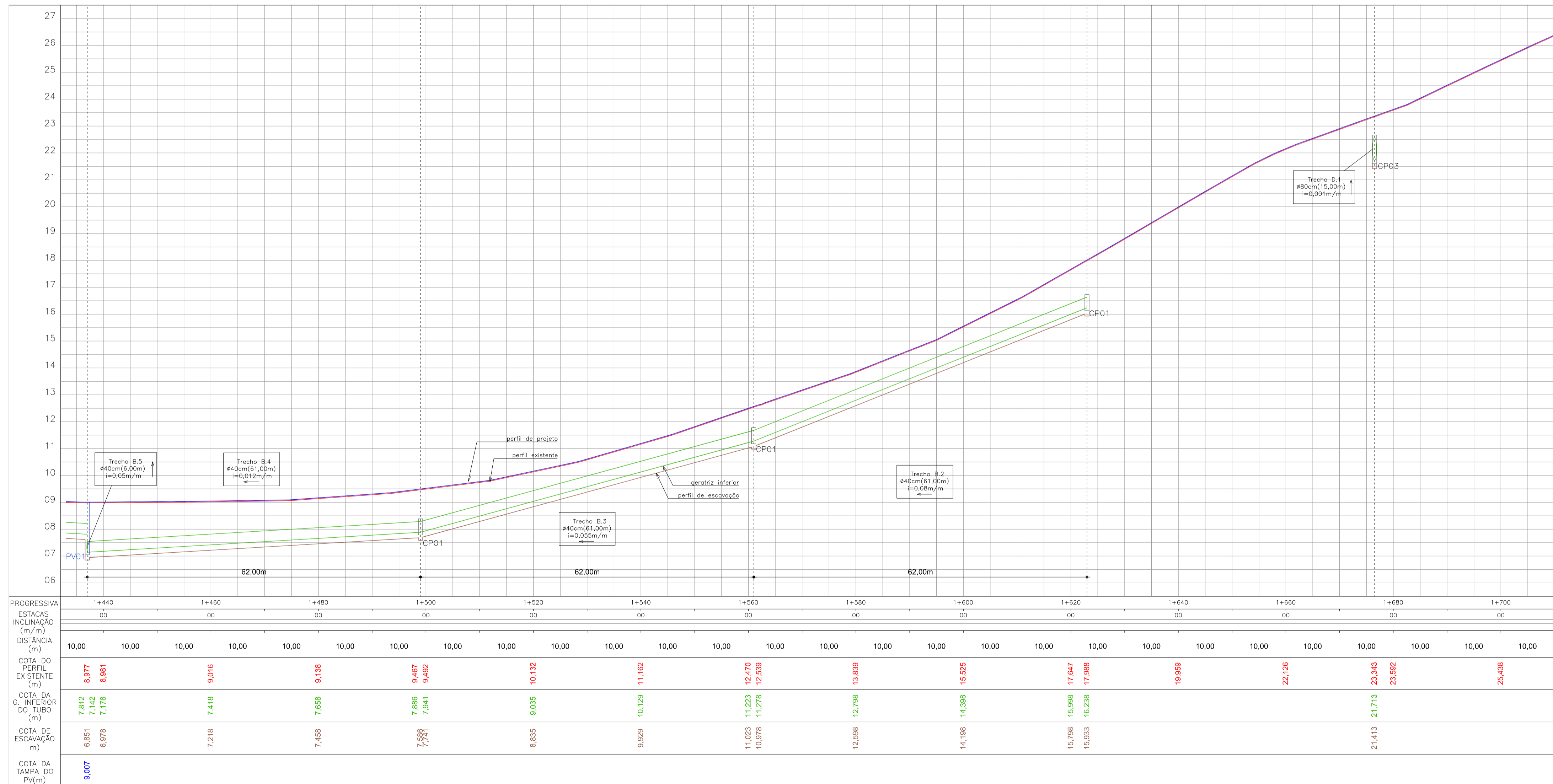
PERFIL LONGITUDINAL - ARTICULAÇÃO 06 - Avenida Falcão Escala 1x1500 y1:100