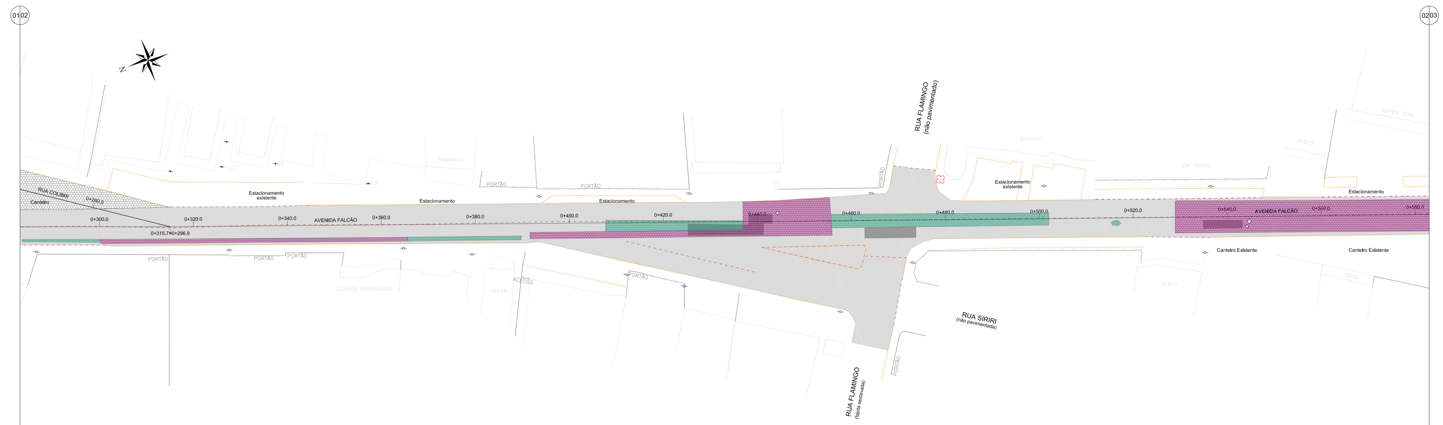
DIAGNÓSTICO DA PAVIMENTAÇÃO EXISTENTE - ARTICULAÇÃO 02 - Avenida Falcão Escala 1:500