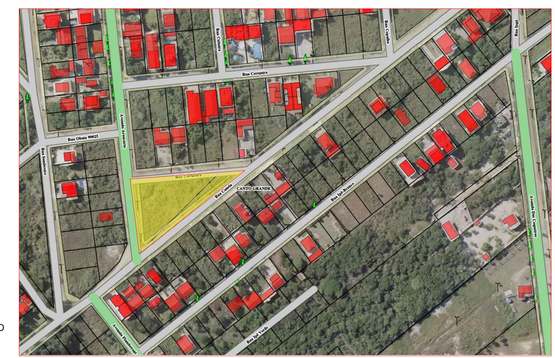
LOCALIZAÇÃO Sem escala.