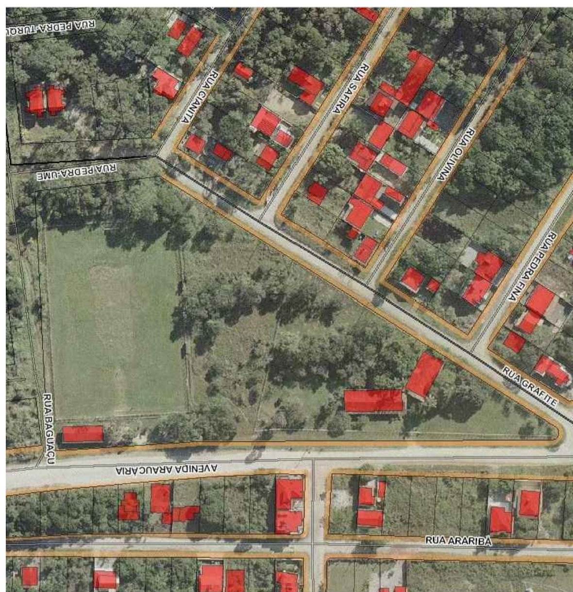
IMAGEM AÉREA DA ÁREA EXISTENTE