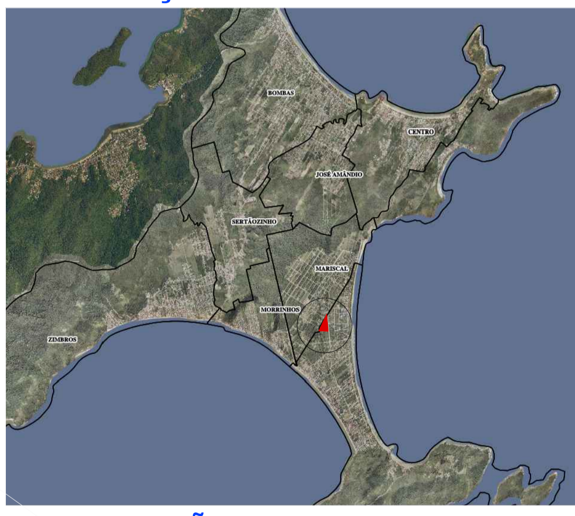
LOCALIZAÇÃO NA CIDADE