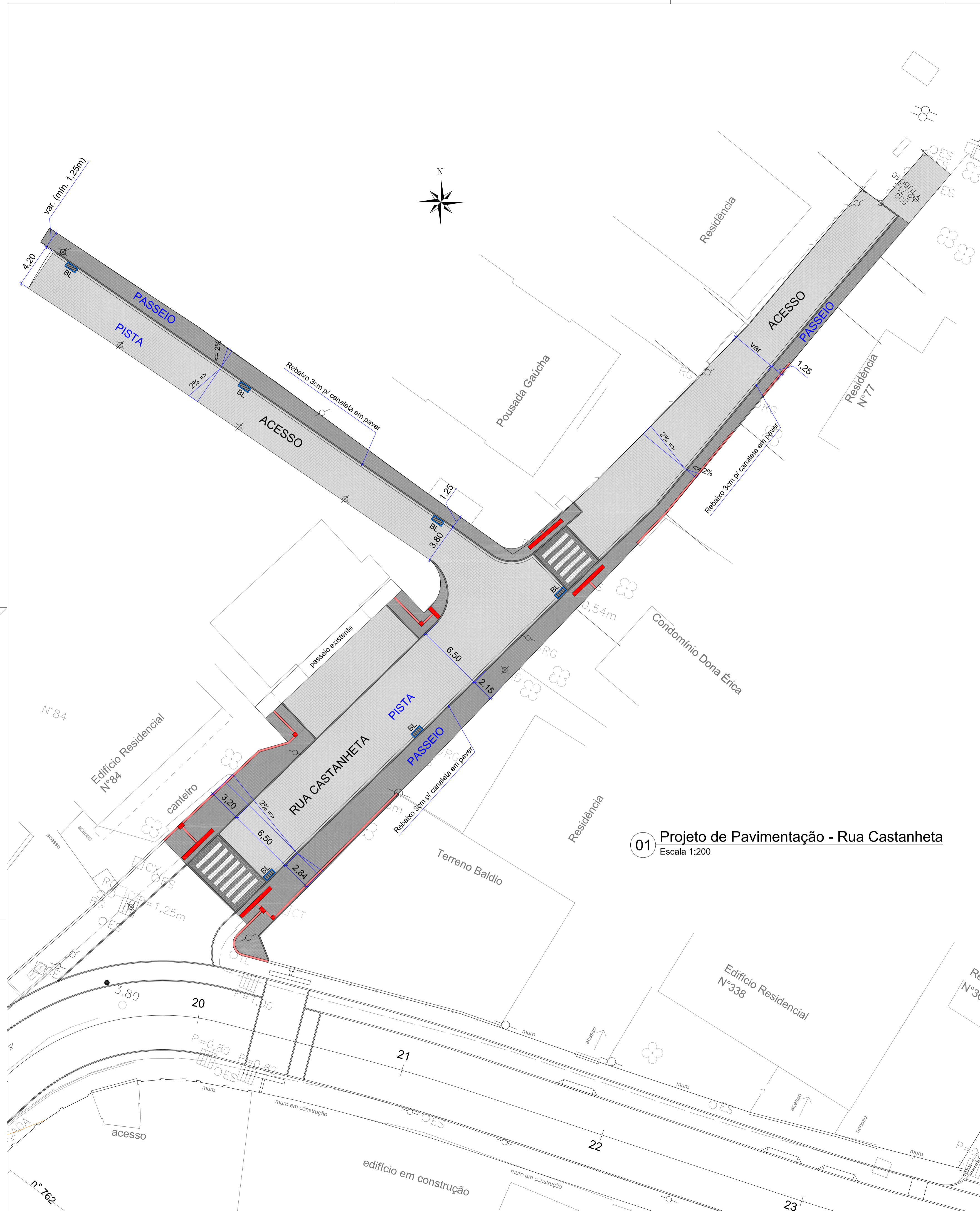
01 Projeto de Pavimentação - Rua Castanheta Escala 1:200