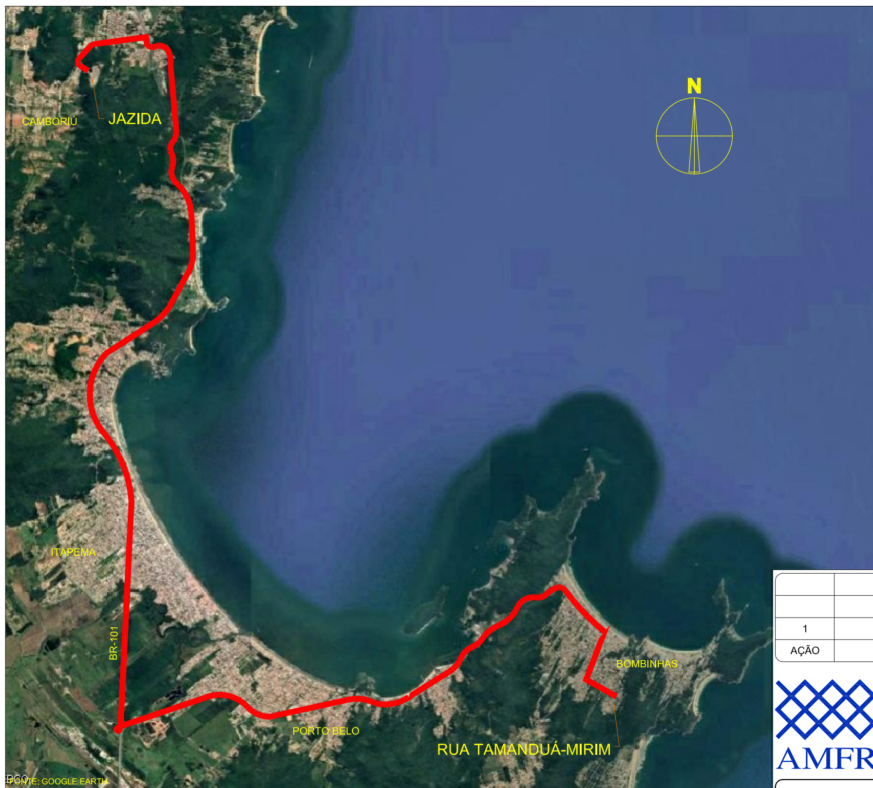
PLANTA DE LOCALIZAÇÃO DA JAZIDA SEM ESCALA