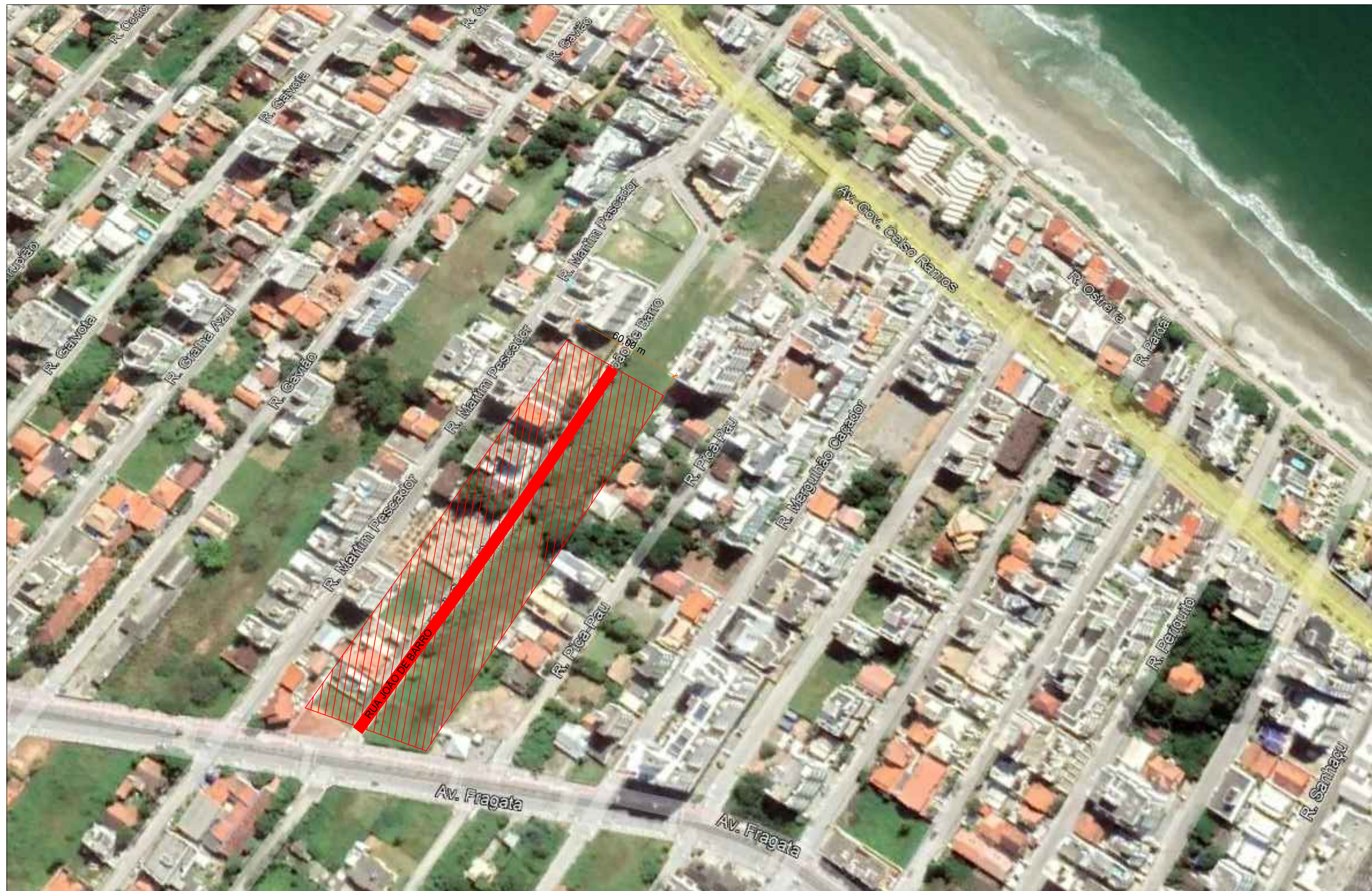
PLANTA DAS ÁREAS DE CONTRIBUIÇÃO SEM ESCALA