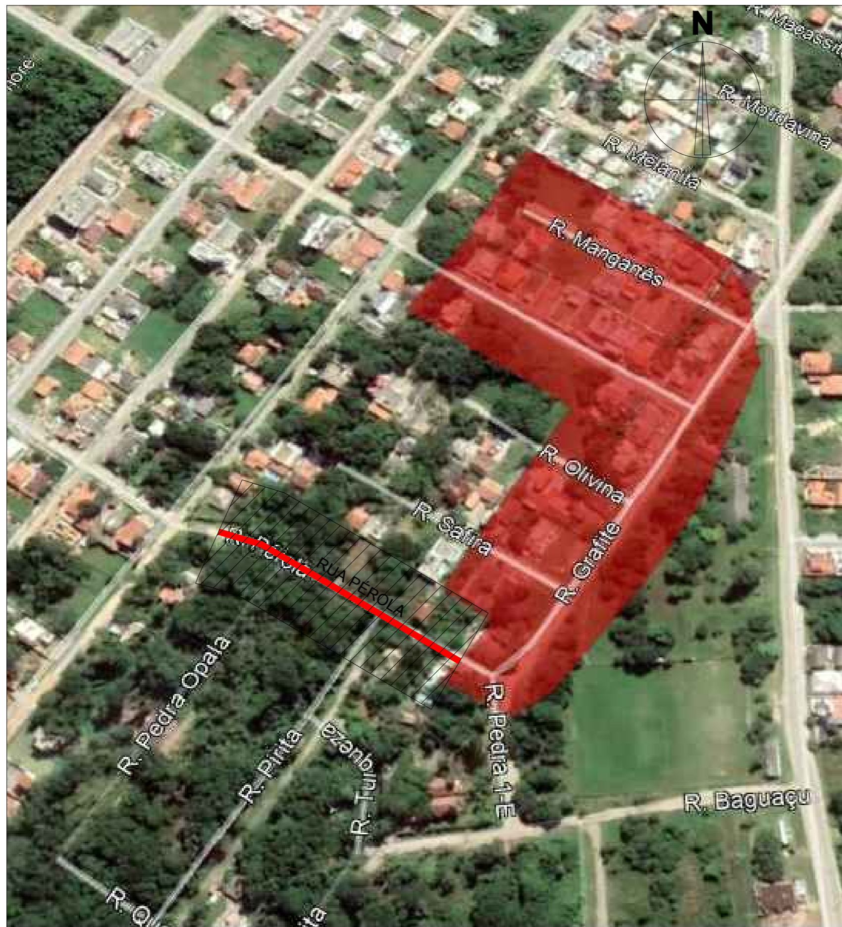
PLANTA DE CONTRIBUIÇÃO SEM ESCALA