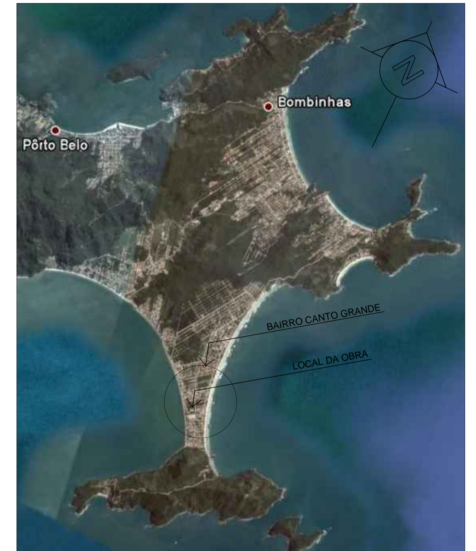
SITUAÇÃO SEM ESCALA