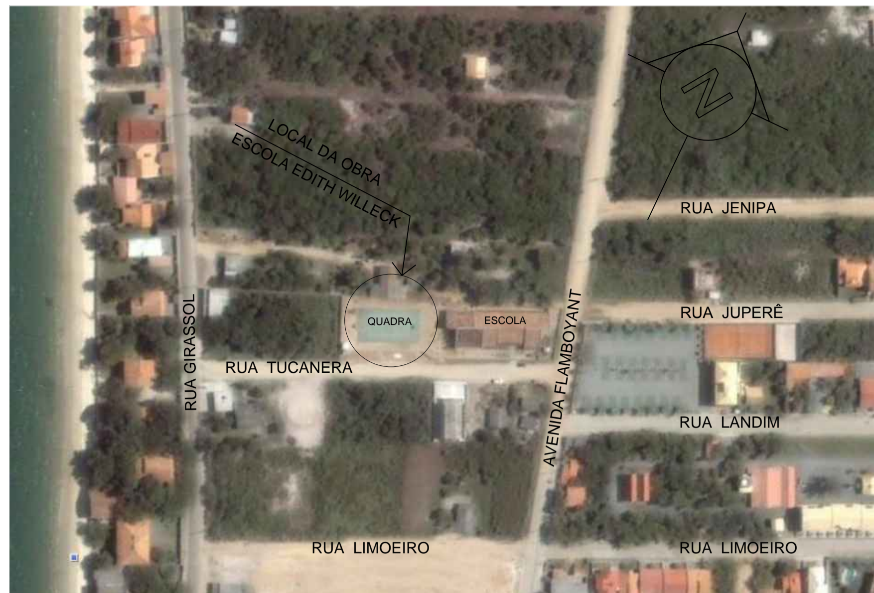
LOCALIZAÇÃO SEM ESCALA