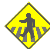
A-32b Passagem sinalizada de pedestres