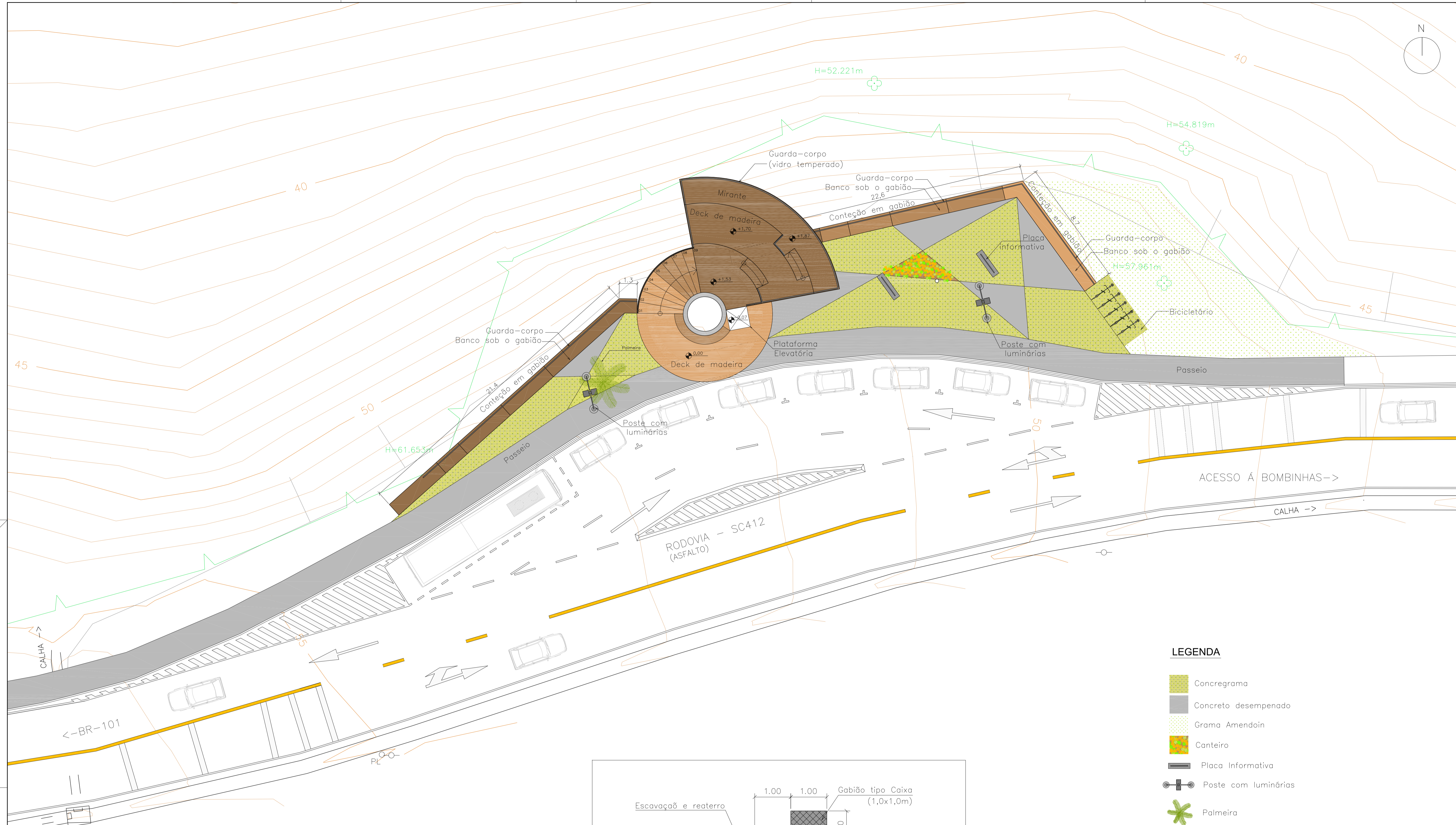
Implantação Geral da Obra ESCALA 1:125