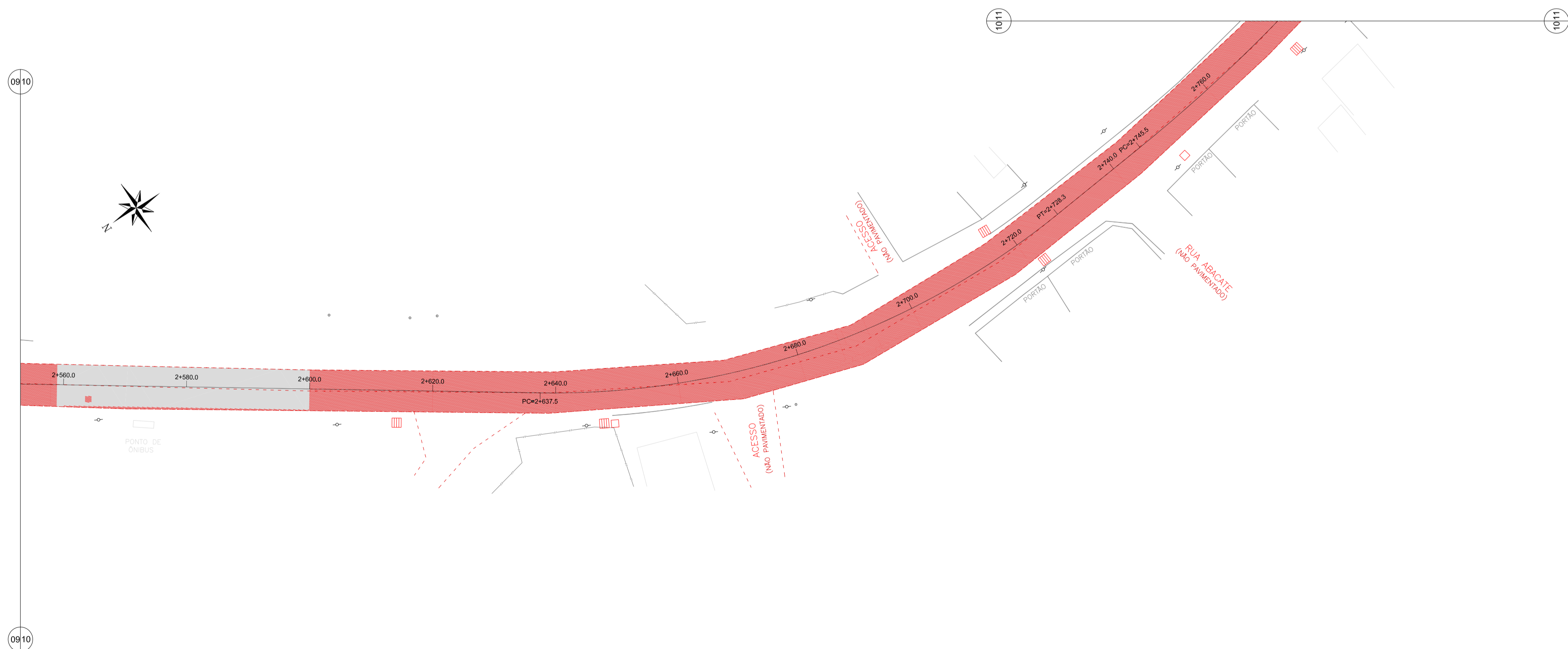
REMOÇÕES E DEMOLIÇÕES - ARTICULAÇÃO 10 - Rua Araçá Escala 1:500