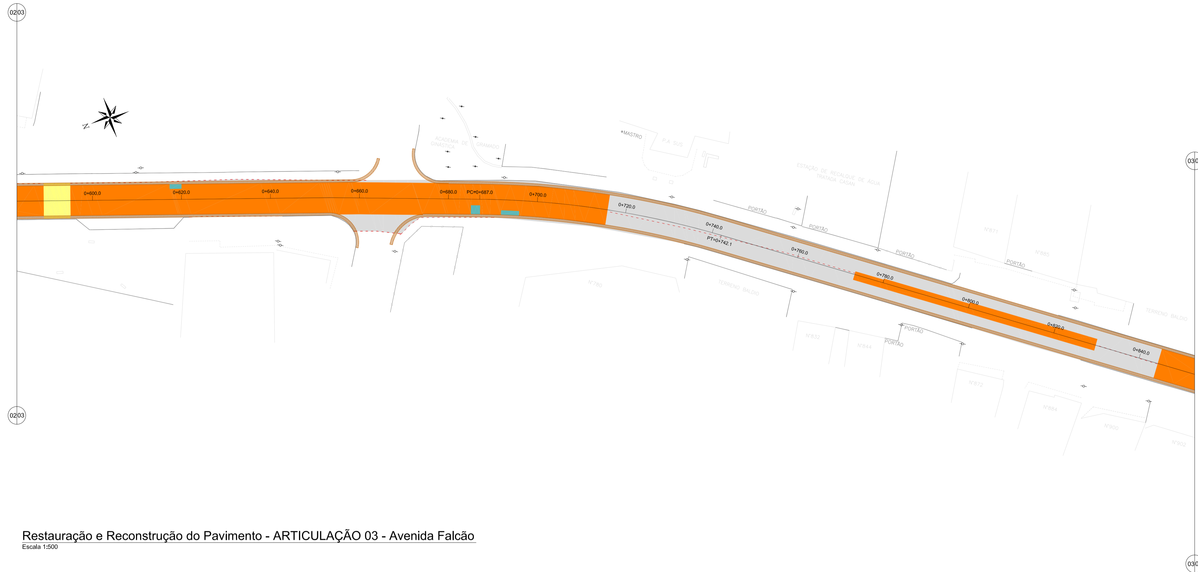
Restauração e Reconstrução do Pavimento - ARTICULAÇÃO 03 - Avenida Falcão