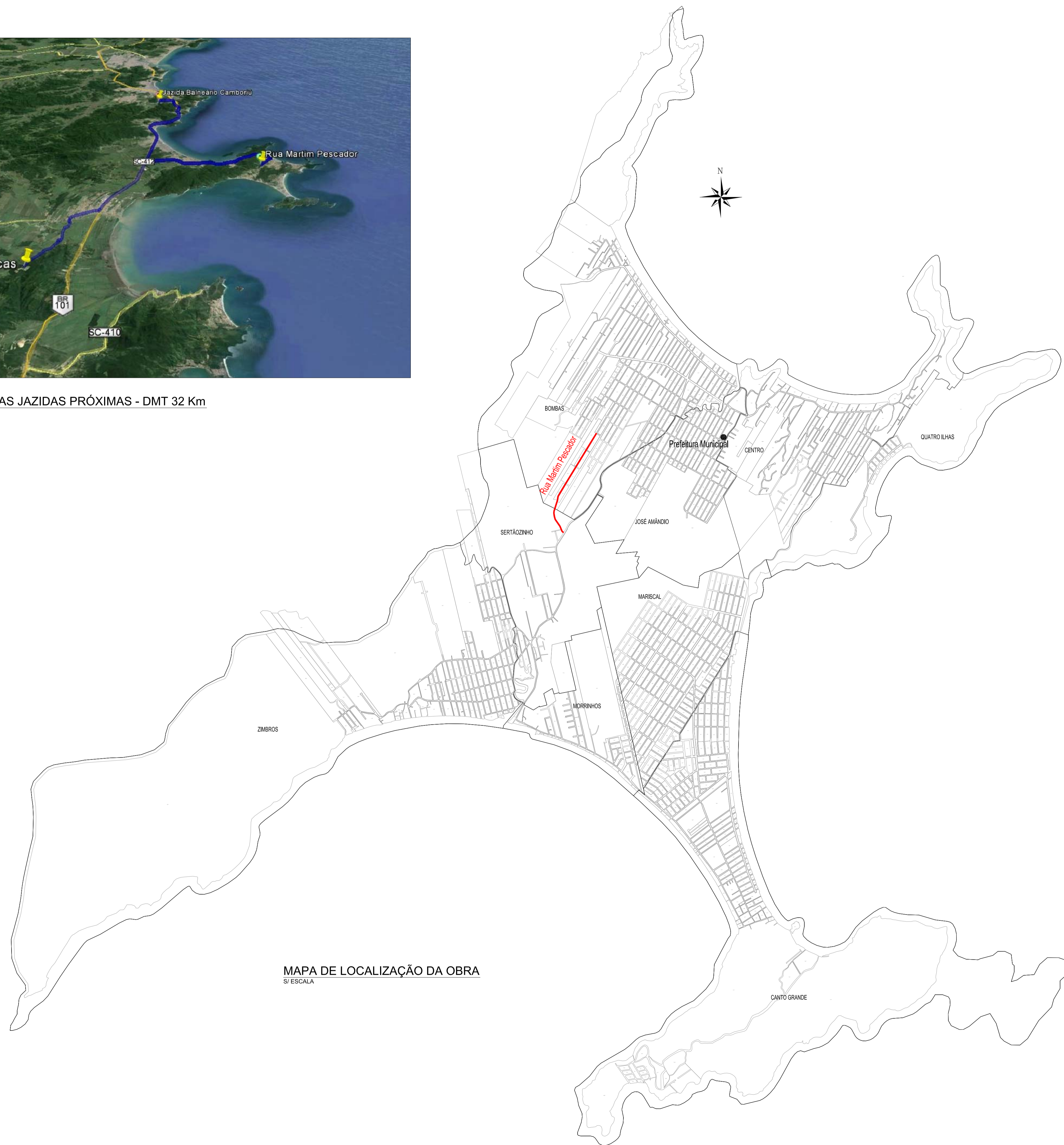
MAPA DE LOCALIZAÇÃO DA OBRA S/ ESCALA