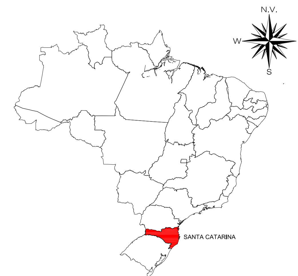
LOCALIZAÇÃO DO ESTADO S/ Escala