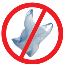
Sacola em plástico de uso único