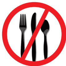
Talheres em plástico de uso único