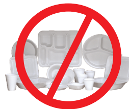
Embalagens de isopor descartáveis