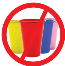
Copos em plástico de uso único

Art. 1º Fica proibida a entrada, comercialização, uso e distribuição , ainda que a título gratuito no Município de Bombinhas de canudos, pratos, talheres, agitadores para bebidas e copos em plástico de uso único, sacolas e sacos plásticos descartáveis, embalagens e recipientes descartáveis de poliestireno expandido (EPS) e o poliestireno extrudado (XPS) popularmente conhecidos como isopor e destinados ao acondicionamento de alimentos e bebidas.