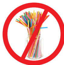
Canudo em plástico de uso único