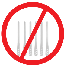
Agitadores de Bebida em plástico de uso único