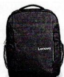
Mochila Lenovo B510 Everyday 15.6"