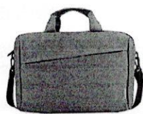
Mochila Transversal Casual T210 Cinza