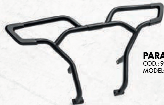
PARA-CHOQUE TRASEIRO COD.: 9DQV-801300-3000 MODELO: CFORCE 450/520