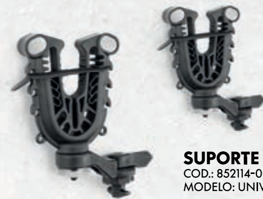
SUPORE DE FERRAMENTAS COD.: 852114-00001 MODELO: UNIVERSAL