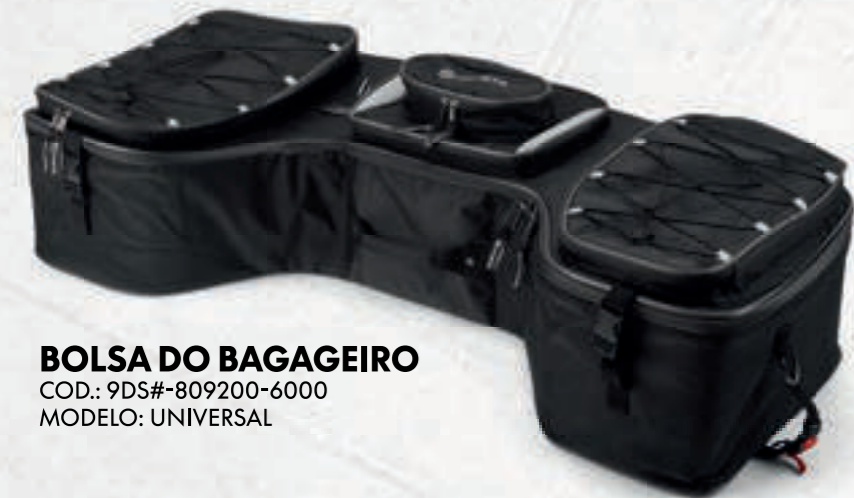
BOLSA DO BAGAGEIRO COD.: 9DS#-809200-6000 MODELO: UNIVERSAL