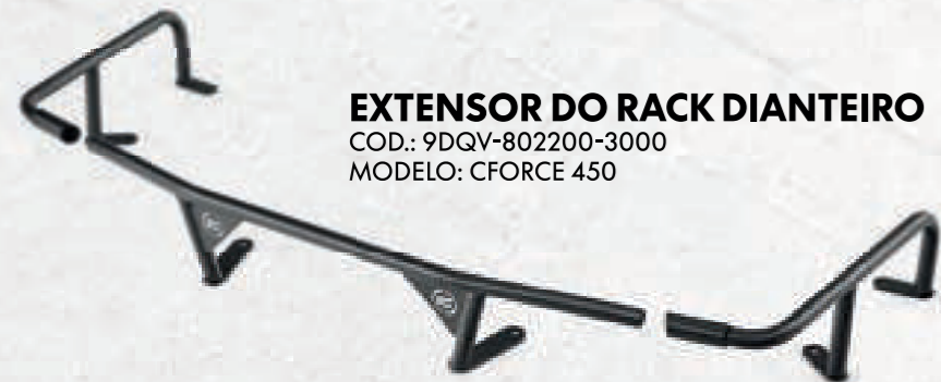
EXTENSOR DO RACK DIANTEIRO COD.: 9DQV-802200-3000 MODELO: CFORCE 450