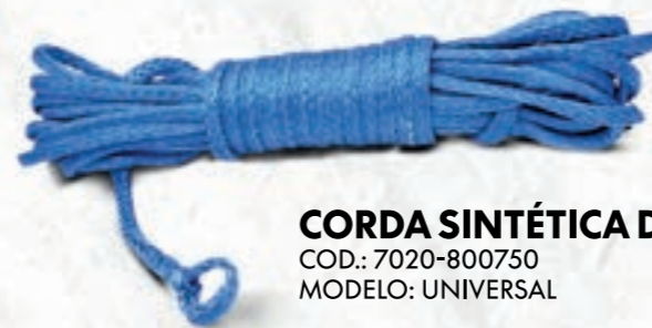
CORDA SINTÉTICA DO GUINCHO COD.: 7020-800750 MODELO: UNIVERSAL