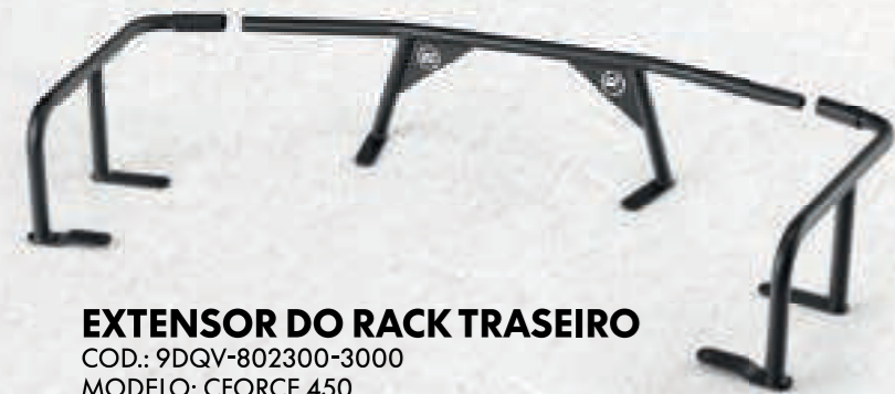
EXTENSOR DO RACK TRASEIRO COD.: 9DQV-802300-3000 MODELO: CFORCE 450