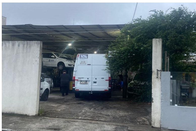
Galpão utilizado para atendimento e guarda dos veículos